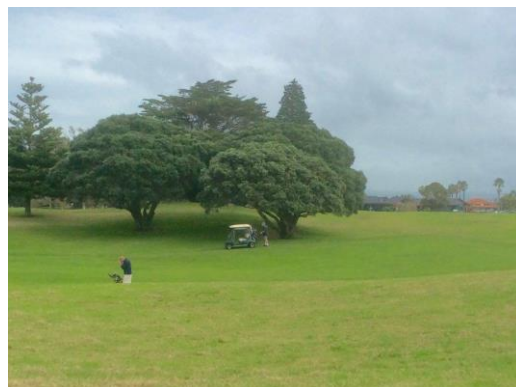
《ゴルフ場》 徒歩 3分