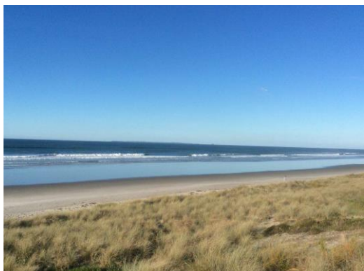
《ビーチ》 徒歩 1分