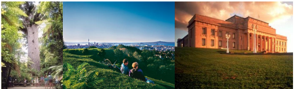
カウリ マウント・イーデン オークランド博物館