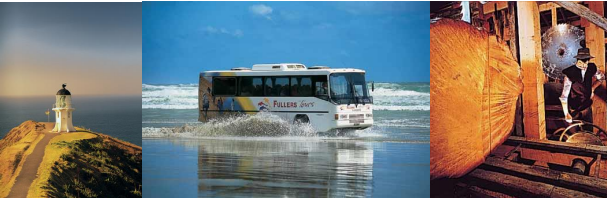
ケーブルインガ岬 90マイルビーチ カウリ博物館