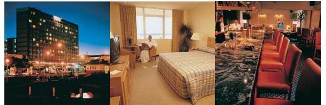
コプソーン・ホテル ハーバーシティ

* デラックスホテル利用は、オークランド滞在部分となります。 コプソーン・ホテル ベイ・オブ・アイランズ