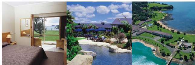
コプソーン・ホテル ベイ・オブ・アイランズ